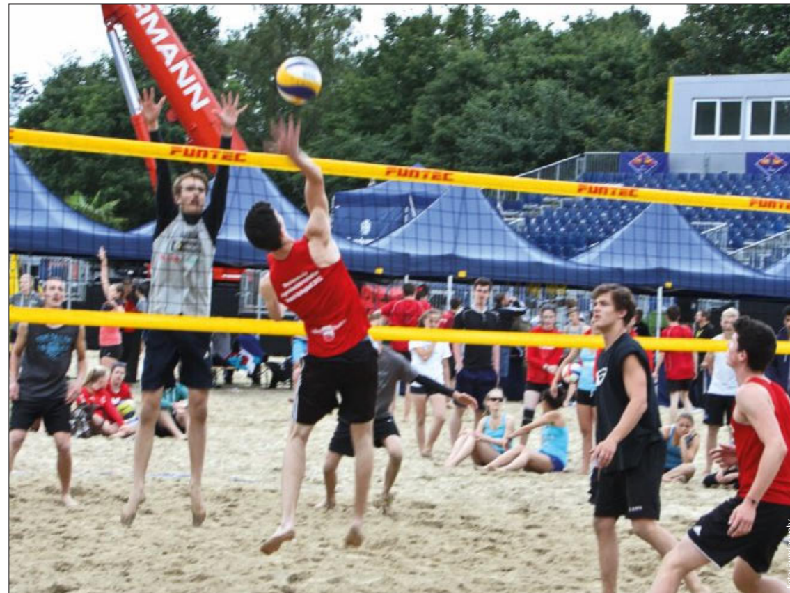
Mit Events inszeniert sich auch die Bundeswehr: 2014 organisierte sie eine Militär-Beachvolleyball-WM.

Eventspezialisten dringen darauf, stärker in die Kommunikationsstrategie ihrer Kunden eingebunden zu werden. Von Uwe Förster