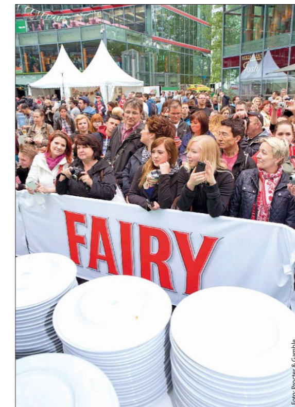
Auf der „Fairy Fiesta“ führte Procter & Gamble die Leistungsfähigkeit seines Spülmittels vor.

trauen transportieren und ihre Marke positionieren wollen, ist seiner Meinung nach überschaubar. Mit Blick auf einer immer größer werdende Kluft zu reinen Umsetzungsdienstleistern prophezeit er: „Es wird eine Marktberreinigung geben.“